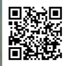
墓苑紹介動画はこちら