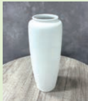
骨壺例 (有田焼名窯「深川製磁」謹製 骨壺)