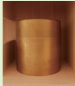
骨壺例 (個別安置用 真鍮骨壺)